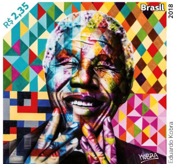
Centenário do Nascimento de Nelson Mandela